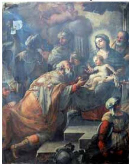
tavola dell'Immacolata tra santa Margherita e san Francesco; Cristo crocifisso di autore ignoto (sec. XVIII-XIX); la natività, autore ignoto (sec. XVIII), dipinto ispirato ai modelli compositivi del Pomarancio. Opere che vanno ad arricchire il complesso di san