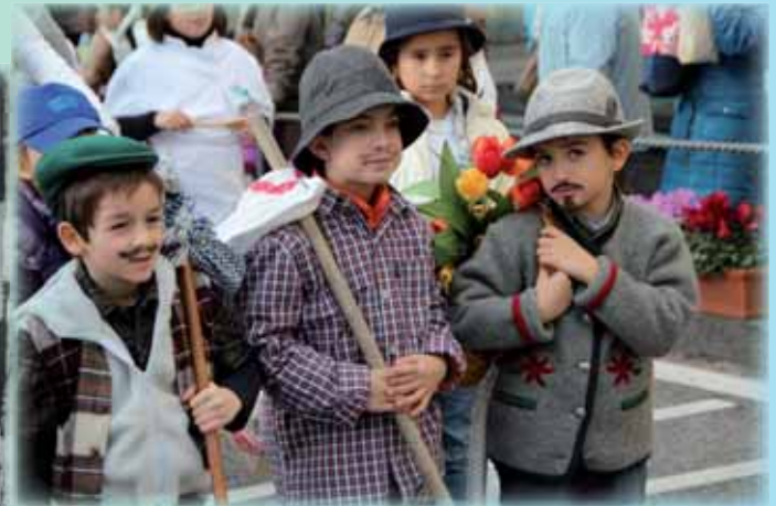
AMALFI: Corteo dei pastori