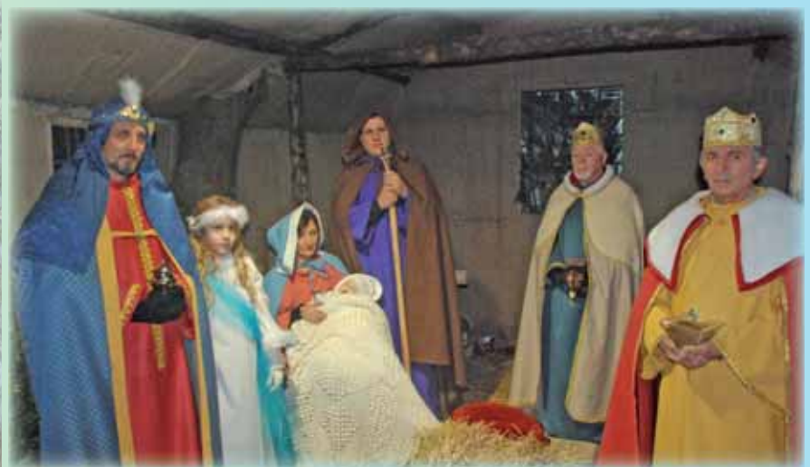
CAVA: S. Maria del Rovolo